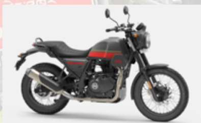
Royal Enfield Scram 411 Euros 65