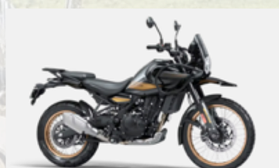
Royal Enfield Himalyan 450 Euros 105